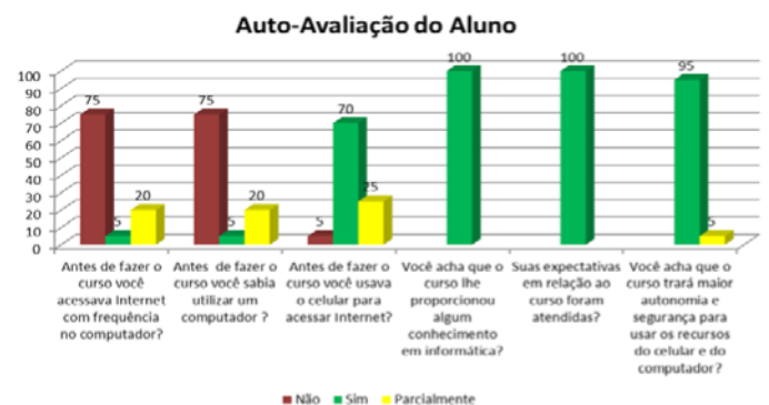
Figura 4 - Resultados obtidos da Autoavaliação do aluno

A infraestrutura do IF Baiano - Campus Catu e do laboratório de informática foi considerada adequada por 100% dos alunos. Como sugestão, 100% da turma relatou a importância de ter uma segunda edição do projeto no ano de 2020, para que outras pessoas também pudessem ser oportunizadas pelo curso.