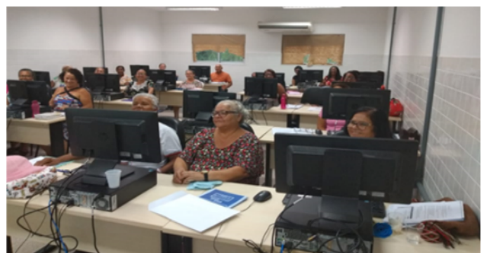
Figura 1 - Alunos durante a aula

As aulas eram executadas no Laboratório de Informática de uso Geral do IFBaiano - Campus Catu (Figura 1), uma vez por semana, tradicionalmente às quartas-feiras. Cada aula contava com o apoio de 3 pessoas (um professor e dois monitores). O professor era responsável por ministrar o conteúdo, enquanto os outros dois monitores eram responsáveis pelo auxílio individual de cada aluno em sala. As aulas foram organizadas em 3 módulos: Noções básicas de computadores, Windows e seus aplicativos; Editores de texto com o Writer; Noções de Internet, busca, e-mail, segurança e uso de dispositivos móveis (celular). O foco era possibilitar conhecimento desde o uso de um computador para tarefas diárias até o uso seguro do celular para execução de outras atividades, como por exemplo, o acesso e uso de e-mail para troca de mensagens, realização de buscas e compra pela web, consultas a sites bancários, entre outras aplicabilidades.