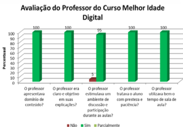
Figura 3 - Resultados obtidos da Avaliação do Professor e Monitores

A atuação do professor e monitores que executaram o curso também foi analisada baseada em fatores como: domínio do conteúdo, clareza e objetividade nas explicações, acessibilidade em aula, presteza e paciência no tratamento dos alunos. A Figura 3 apresenta os resultados obtidos, e diante dos fatores elencados professor e monitores tiveram a aprovação da turma considerando que a média dos fatores com resposta SIM foi de 100% para monitores e 99% para o professor.